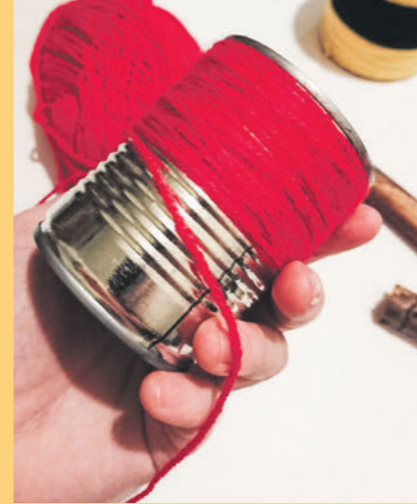
Und so geht es ...

Wer ein Bienchen oder Marienkäfer macht, kann gerne noch Augen aus Knöpfen oder Filz annähen (wenn das nicht geht, dann kleben).